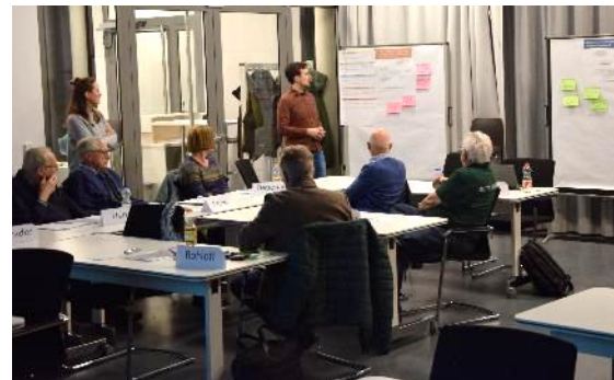
10. LAG-Sitzung 10.02.2026

werden durch die Geschäftsstelle und das Regionalmanagement aufgegriffen und mit den weiteren Beteiligten weiterentwickelt. Für den weiteren Verlauf der aktuellen Förderperiode sowie für die Zukunft hat die Evaluation wertvolle Impulse geliefert, die in die gemeinsame Arbeit für die LEADER-Region einfließen werden. Den vollständigen Bericht finden Sie auf der Website der LEADER-Region Aue-Wulbeck .