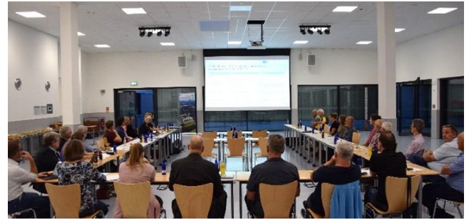
Sitzung der LAG Aue-Wulbeck

Die Lokale Aktionsgruppe (LAG) hat eine zentrale Funktion bei der Entscheidungsfindung über die Verteilung der zugesprochenen Fördermittel in Höhe von etwa 2,8 Millionen Euro für einen Zeitraum von 5 Jahren. Die LAG besteht aus Vertretenden verschiedener Interessengruppen, dies sind Vertretende der Kommunen sowie Personen aus Wirtschaft und Gesellschaft der Region Aue-Wulbeck. Die LAG trifft Entscheidungen auf Grundlage des Regionalen Entwicklungskonzeptes. Das Regionale Entwicklungskonzept (REK) wurde unter breiter Beteiligung der Akteur*innen der vier Kommunen erstellt und stellt die zentrale Strategie für die regionale Entwicklung der LEADER-Region Aue-Wulbeck dar. Darin sind sowohl die Förderrahmenbedingungen als auch erste Projektideen formuliert und es enthält umfassende Informationen über die langfristigen Ziele und Prioritäten der LEADER-Region Aue-Wulbeck.