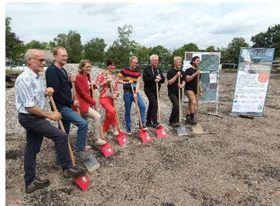
Spatenstich am Bikepark in Burgwedel, @mensch und region

Nicht mehr lange, und die Region Aue-Wulbeck ist um eine Attraktion reicher. Am 18.06.2024 erfolgte der erste Spatenstich eines LEADER-geförderten Projektes der Aue-Wulbeck-Region: Der Bikepark in Burgwedel, der ab September Radsportbegeisterten jeden Alters offenstehen wird. Daneben werden auf dem Parcours, der für Anfänger*innen und Fortgeschrittene gleichermaßen konzipiert ist, auch Skater*innen, Inline-Fahrende sowie Rollstuhlfahrer*innen auf ihre Kosten kommen. Errichtet wird das neue, regional einzigartige Freizeitangebot, durch die in der Szene bekannte Firma Schanzenwerk. Am 07.09. um 14 Uhr findet die feierliche Eröffnung des Bikeparks statt, zu welcher alle Interessierten herzlich eingeladen sind. Das Amt für regionale Landesentwicklung