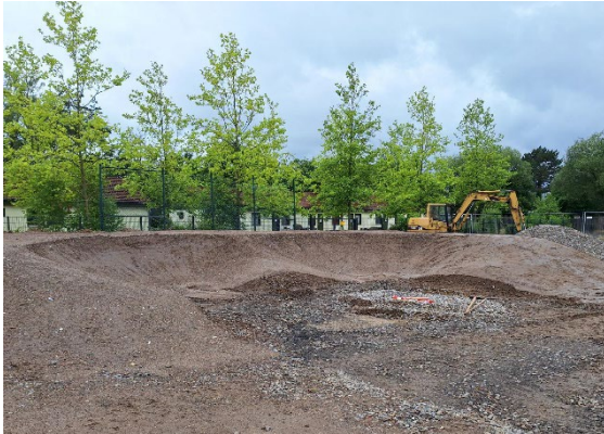
Bauarbeiten am Bikepark

Leine-Weser hat für das Projekt ca. 260.000 € aus LEADER-Mitteln bewilligt. Zusätzlich wird es mit weiteren ca. 32.500 € über die Regionale Ko-Finanzierungsrichtlinie (REKO) der Region Hannover unterstützt. Den verbleibenden Anteil der Ko-Finanzierung übernimmt die Stadt Burgwedel.